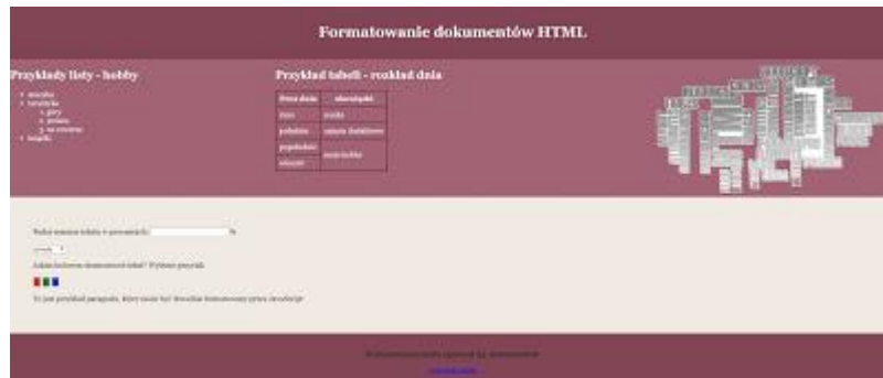
Obraz 2. Witryna internetowa